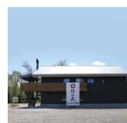
上川大雪酒造「緑丘蔵」