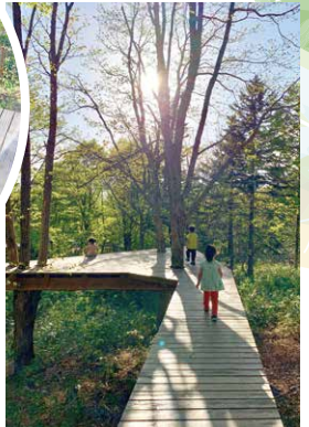
鳥の目になるテラス