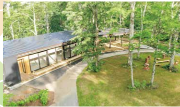
交流体験棟「チュプ」