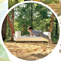
リング型揺れるベンチ