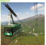
黒岳ロープウェイ