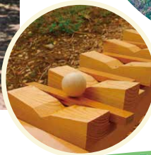
全長40m 森の木琴 作家集団インビジブル・デザインズ・ラボ(音楽制作会社)の作品です。